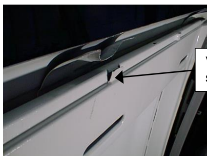
Verprägung beidseitig einschneiden