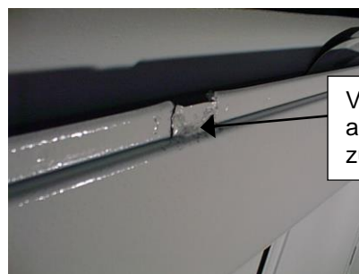
Verprägung nach außen umlegen oder zurückstellen