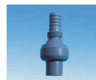
Rückschlagventil mit Entlüftung / non-return- valve with venting 3004.53.00