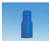
Entlüftungsstutzen / vent connection C1.0605.01