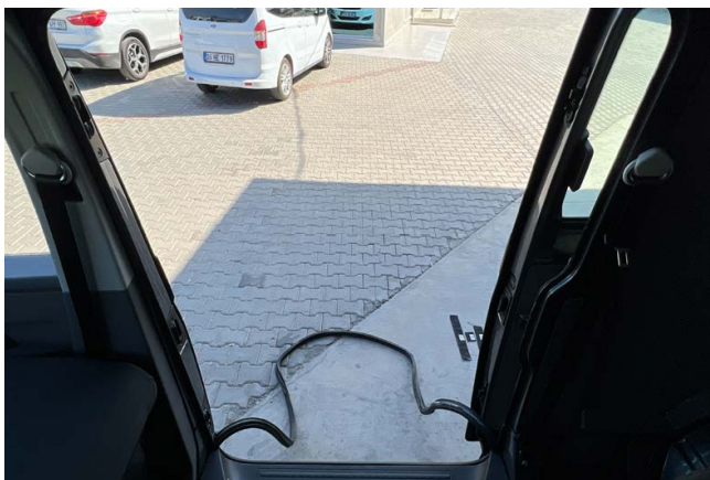
1 DE: ENTFERNEN SIE DIE GUMMIDICHTUNG DES SCHIEBETÜRAUSSCHNITTES EN: REMOVE THE SEAL FROM SLIDING DOOR CUT-OUT