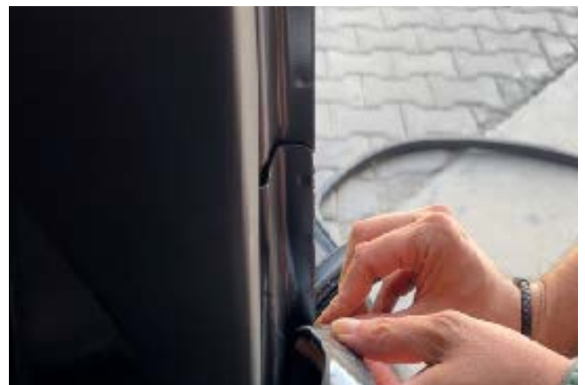
2 DE: KLEBEN SIE TEIL NR. 1 Vom Innenraum des Fahrzeuges aus einkleben EN: STICK PART NO. 1 Stick it from inside the car