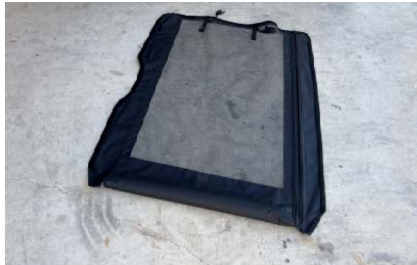
EN: PACKAGING CONTENT: 1 Mosquito net for sliding door (right) 9 parts with self-adhesive velcro