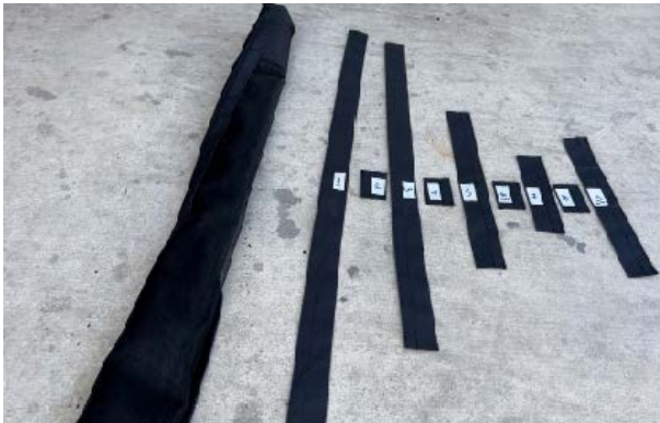
DE: LIEFERUMFANG: 1 Moskitonetz für Schiebetür 9 Streifen selbstklebendes Klettband